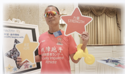
香港願望成真基金籌款

「失明長跑選手」是一個甚具綽頭的稱號，也因為這個稱號，他為多個慈善團體，包括「匡智會」、「導盲犬協會」和「母親的抉擇」等籌得總數過百萬元善款。「我10月將會到日本，由南部鹿兒島跑到北部的青森，全長2400公里，為『香港願望成真基金』籌款而跑。」